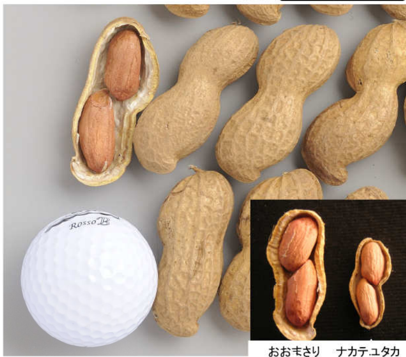
おおまさり ナカテユタカ

材料：生落花生1kg(莢付、水洗い後)、水2ℓ、塩大さじ4(お好みで加減)。 加熱時間：40~50分(水から始めて)。