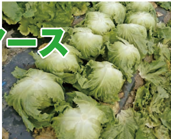
球揃いに優れ、切り口も小さい「フレッシュアース」

ここ数年、茨城県の秋の気温は、初秋に急激な温度低下に見舞われた2016年、夏以降低温で推移した2017年、冬まで温暖だった2018年と、年による変動が激しく、予測が立てにくくなっています。弊社では、どのような年でも対応できる「フレッシュアース」を茨城県西部地区で試験し、想定通りの結果を得ましたのでご報告します。