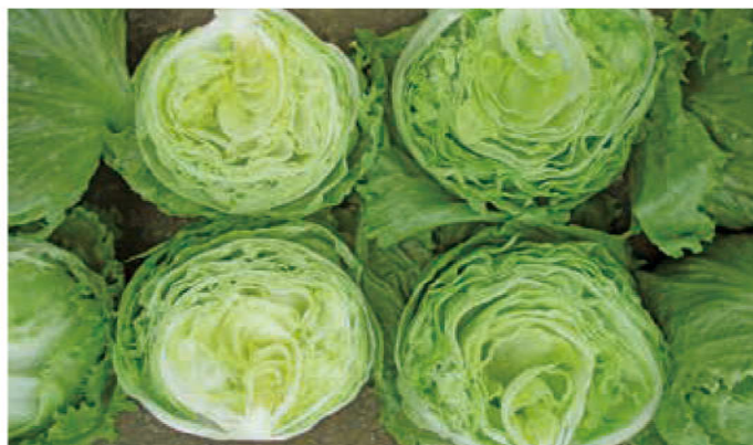
「WN-LL728」 対象品種 10月22日播種、2月15日収穫 茨城県坂東市長須地区

2020年早春は、例年と異なりこの時期の風が弱く、湿度が下がりにくかったことに加え、もともとトンネルによって湿度が上がりやすい条件下ということもあり、べと病リスクの高い年でしたが、「WN-LL728」はべと病にもよく耐えました。様々な防除体系を駆使して頂きながらではありますが、圃場歩留まりの向上に貢献できると考えています。