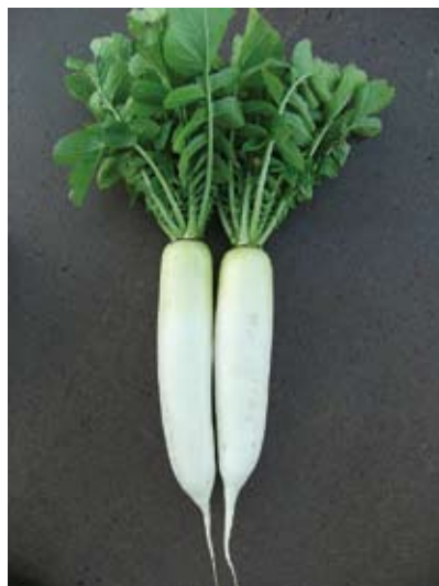
肌がとてもきれい