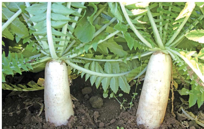
やや葉が旺盛で、抽根部がほどよく長いので抜きやすい「令白」ダイコン