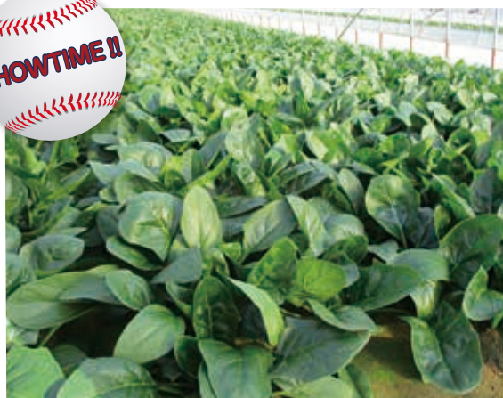
(茨城県鉾田市 撮影:12月21日ハウス栽培)

作業性抜群!ポリウム満点!播種幅も広い!3拍子揃った「ショータイム」ハウレンソウ。試作2年目、各地で良い評価を頂いております。秋まき品種の選択にお悩みの皆さま、ぜひ「ショータイム」ハウレンソウをお試ください!関東平坦地であれば、 9月中旬~2月下旬まで播種可能で、収穫期は10月中旬~4月上旬までと幅広く収穫できる のが魅力です。(※厳寒期はハウス又はトンネル栽培)