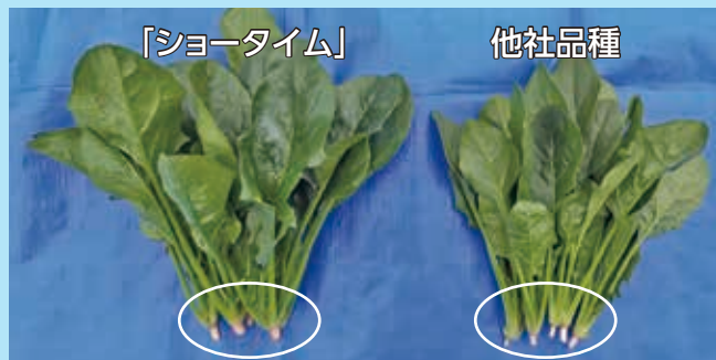
(埼玉県川越市 播種:11月15日 収穫:2月21日 トンネル)