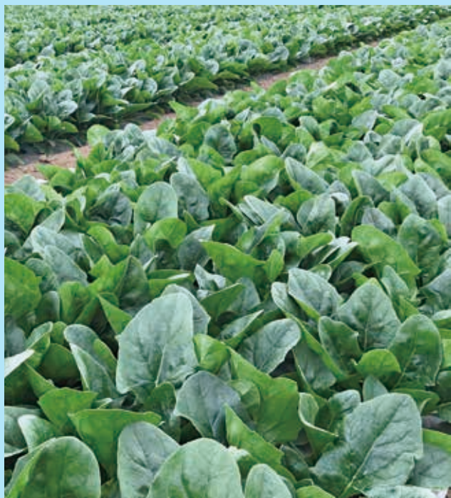
(埼玉県川越市 撮影:12月3日露地栽培)