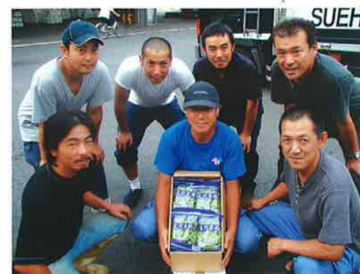
エダマメ生産者のお仲間と「とよふさ」。出荷先である上福岡市場の方も一緒です。