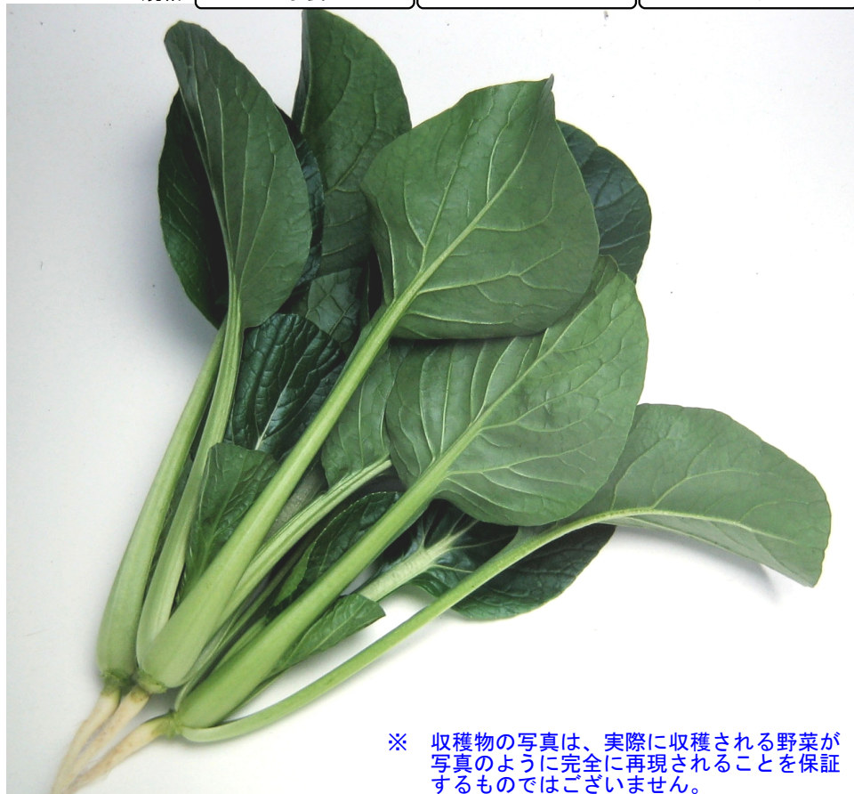
※ 収穫物の写真は、実際に収穫される野菜が写真のように完全に再現されることを保証するものではありません。

*1 根こぶ病はレースや菌密度によっては発病することがあります。激発地では殺菌剤を使用して下さい。