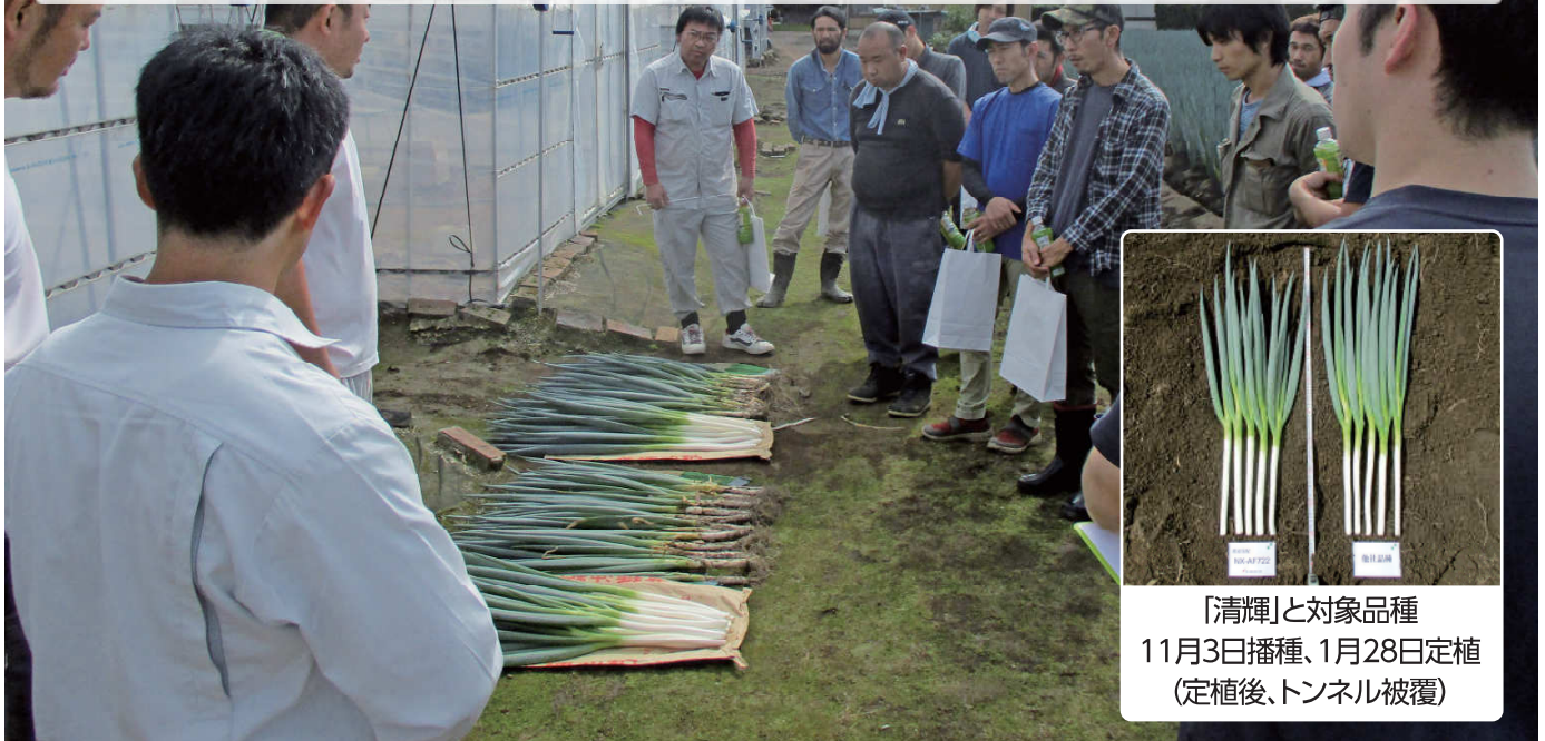
「清輝」と対象品種 11月3日播種、1月28日定植 (定植後、トンネル被覆)

写真:「清輝」を前に検討会で熱心に議論を交わすJA岩井・グループファイブの皆様（茨城県坂東市）