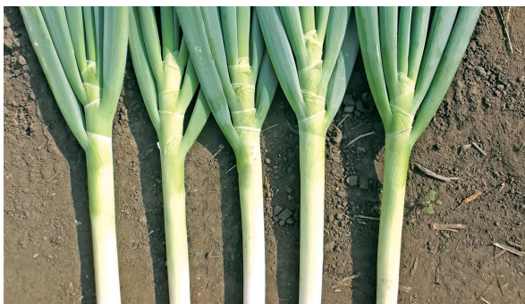
首締まり良好な「輝光」