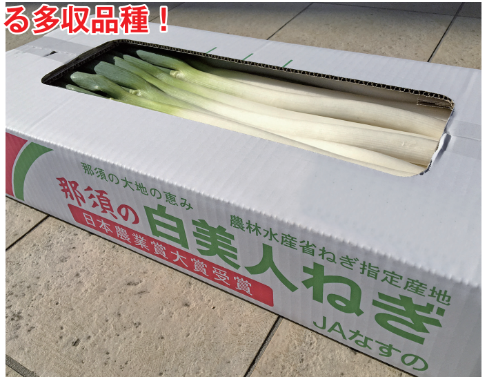
「那須の白美人ねぎ」輝光

大田原市は、栃木県北西部に位置し、比較的冷涼な気候を活かしたネギ栽培が盛んです。JAなすのネギ部会の「那須の白美人ねぎ」は、辛みがほとんどなく柔らかくて甘いネギとして人気で、その品質の高さは、市場関係者から高い評価を得ています。今回ご紹介する「輝光」は、耐病性、作業性、在圃性と3拍子揃った、とても栽培しやすい品種として評価頂きましたのでご紹介致します。