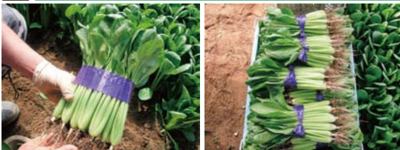
◀束を作る際に結束帯で腰がくびれないため、荷姿が美しい ◀葉先がよく揃うのでFG袋詰めでも見栄えが良い

取材した生産者様では今後も引き続き「優翠」をご利用いただきます。品種特性の詳細は前ページ、または各営業担当までおたずねください。