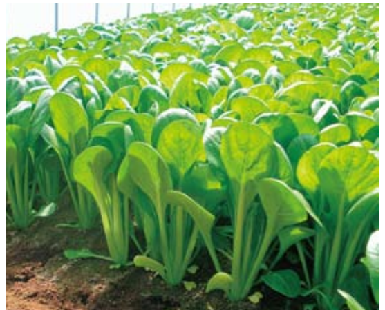
▲草姿が極立性で収穫しやすい「優翠」

今回取材した八潮市の生産者様は一年を通じてコマツナを栽培しています。試験栽培を行うことで品種の特性を的確に捉え、時期ごとに品種を使い分けています。「優翠」は2011年の1月蒔きから本格的にご利用いただいています。