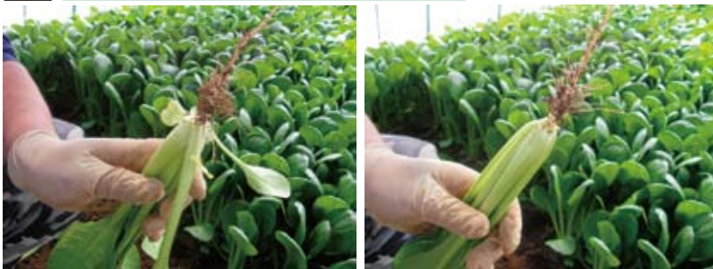
◀下葉が容易に取れ、調整作業が極めて効率的 ◀細根が少なく、洗浄が容易