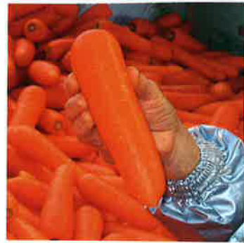
8月3日播種 4月5日収穫の「べにもり」

まず、下のグラフを見てください。 「べにもり」の出荷時期と 大田市場における過去5年間のニンジン市況の 推移を比較したものです。