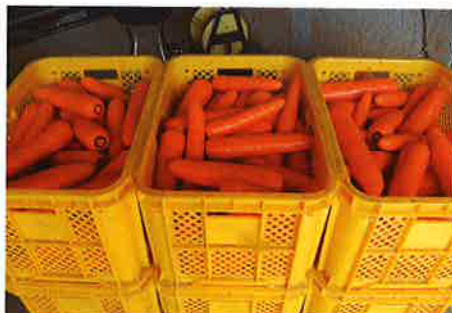
8月1日播種 3月19日収穫(茨城)