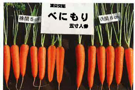
株間5cmの密植も可能