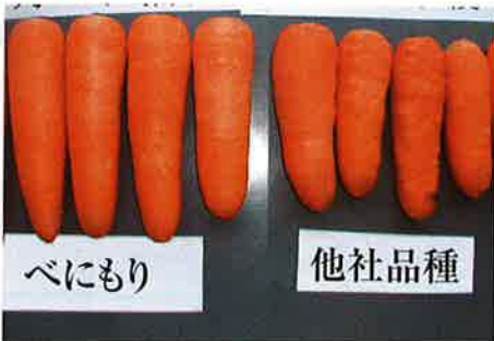
8月5日播種 3月20日収穫(千葉)