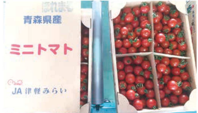
箱詰めされた「ほれまる」