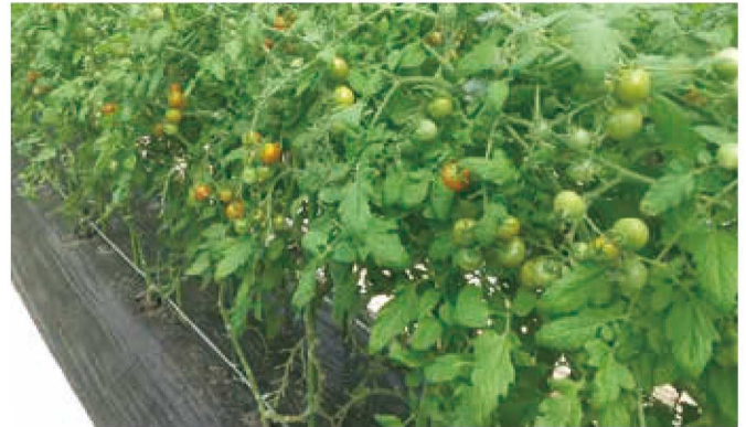
きれいに整枝され、栽培管理されたハウス栽培の「ほれまる」