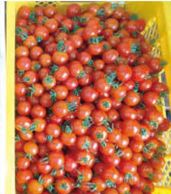
7月20日収穫の「ほれまる」